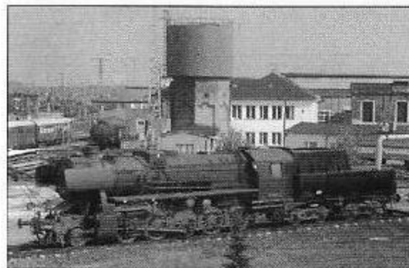
Traditionslok BR 52

Das Museum verfügt über Archivmaterial mit Text- und Bilddokumenten