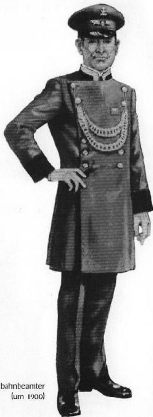
Eisenbahnbeamter (um 1900)