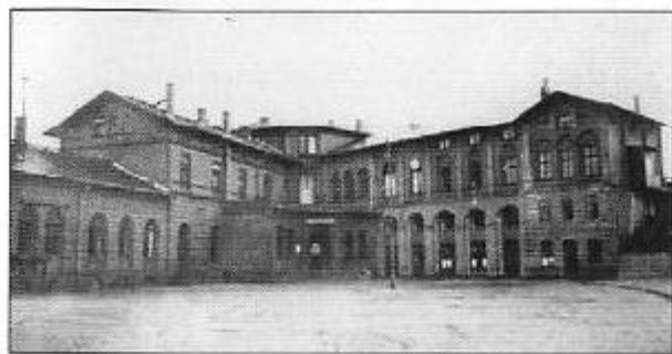
Ehemaliges Bahnhofsgebäude (um 1900)

In der Geschichte unserer Region spielt die Stadt Falkenberg/Elster als Eisenbahnknotenpunkt eine bedeutungsvolle Rolle.